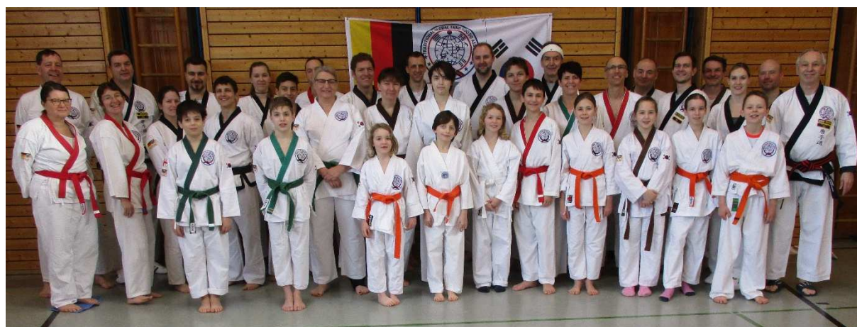
Teilnehmer des Waffenlehrgangs in Königsbrunn

Es war schön festzustellen, dass die Stimmung und der Umgang untereinander immer noch so offen, freundlich und herzlich ist, wie er es seit 1995 immer war. Dieser wichtige und lebendige Teil des Tang Soo Do hat sich nicht geändert und wird auch in Zukunft hoffentlich so fortbestehen und eine wichtige Rolle für die Zukunft spielen. Ich habe über die 20 Jahre gelernt, dass diese Lehrgänge viel mehr bringen als technische Details, sie vernetzen und verbinden die Menschen miteinander. Wir alle sind Gefährten auf dem Weg der Kampfkunst, dem „DO“ in Tang Soo Do.