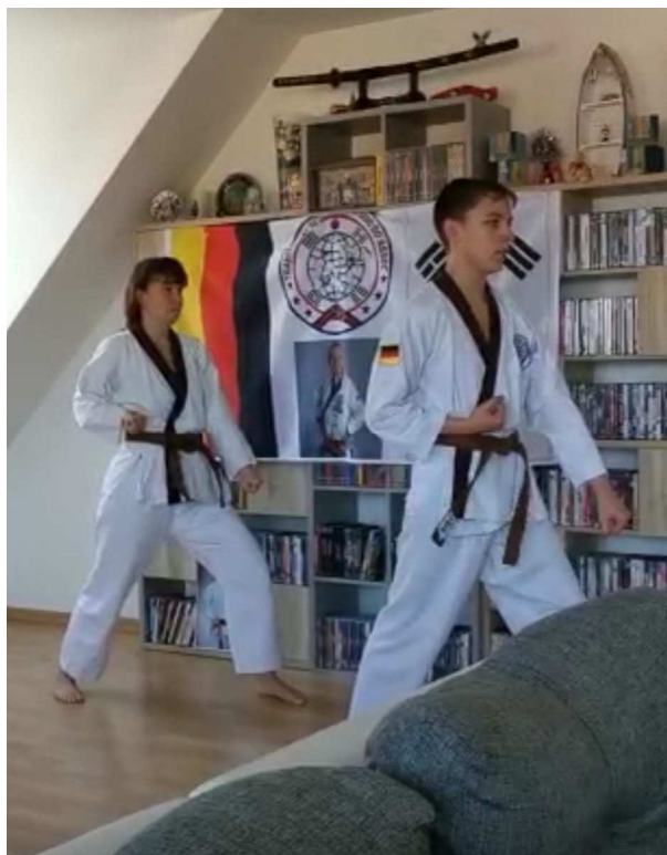
Prüfung – zu Hause!

Am Prüfungstag selbst war ich so aufgeregt wie immer vor einer Gup Prüfung, das hat sich auch gleich beim Einloggen bemerkbar gemacht, ich brauchte drei Anläufe. Die Prüfung selbst unterschied sich nicht von einer anderen im Tang Soo Do. Die Shim Sa Kwan Nim (Prüfer) sagten oder zeigten was sie sehen oder hören wollten. Es war ein kleiner Rahmen zwei Shim Sa Kwan Nim (Prüfer), drei Yu Gup Ja (Farbgurtträger) und ein Cho Bo Ja (Anfänger) inklusive mir.