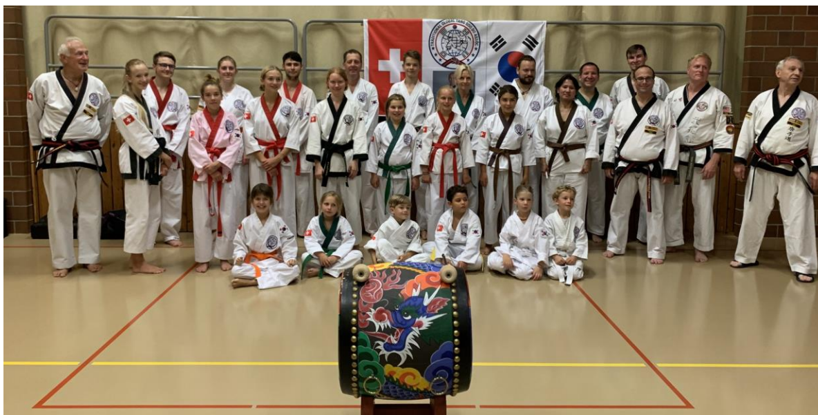
Teilnehmer des Sommerlehrgangs in Hemishofen / Schweiz

Der Sommerlehrgang der koreanischen Kampfkunst Tang Soo Do in Hemishofen in der Schweiz vom 18.09.2020 – 20.09.2020 war ein großer Erfolg. Egal ob Groß oder Klein, ob Schwarzgurt oder Weißgurt jeder konnte für sich selbst etwas mitnehmen und eingeschlichene Fehler korrigieren.