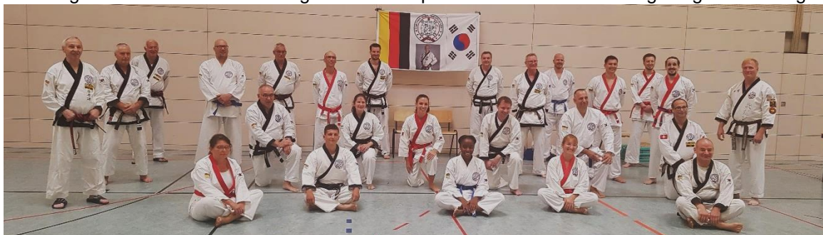
Prüflinge, Vorturner und Prüfer

Selbst das Sparring fand mit notwendiger Distanz statt. Auch der obligatorische Bruchtest wurde durchgeführt! Das internationale Prüfungsgremium aus Deutschland, Schweiz und USA prüfte trotz der notwendigen Distanz zueinander eingehend die Aspiranten. Man war mit den gezeigten Leistungen und