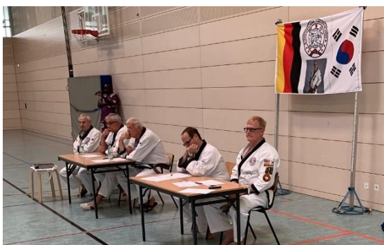
Prüfer bei der Arbeit

Die Dan-Prüfung wurde in zwei Gruppen durchgeführt. In der ersten Gruppe mit 10 wurden die Schwarzgurt Anwärter und die zum 1. Dan und in der zweiten mit 6 die zum 2. und 3. Dan geprüft.