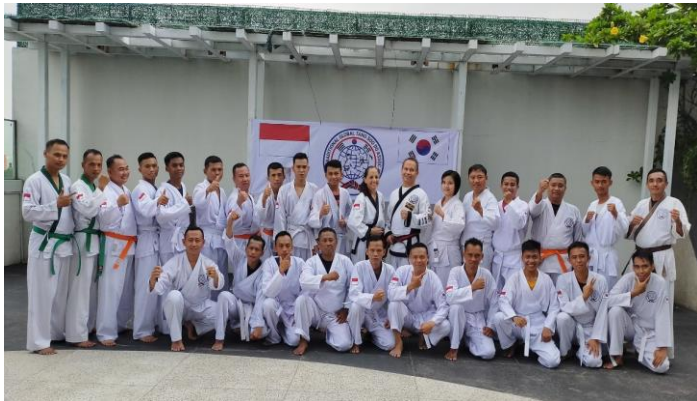
Indonesia Tang Soo Do