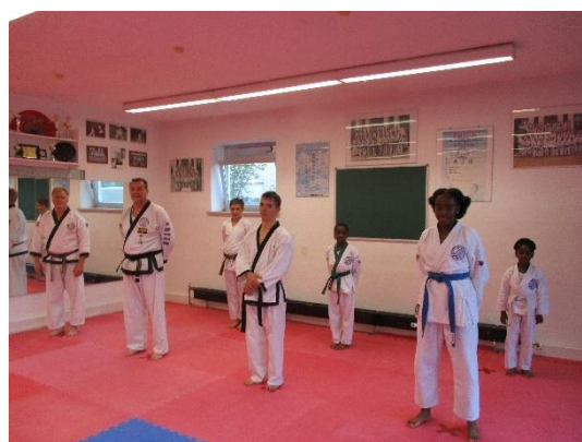
Training im Studio Esting

Seit Mitte Juni findet wieder ein geregeltes Training im Kampfkunststudio Esting statt. Während des Lockdowns habe 2 Trainer unter zur Hilfenahme des Zoom Meetings Verfahren ein Training für die Interessenten 2 Mal wöchentlich zu Hause aufrechterhalten. Für diejenigen, die sich nicht an diese ungewohnte Art des Online Trainings beteiligt hatten, war es ein freudiges Ereignis, dass sie wieder persönlich zum Training erscheinen konnten. Entsprechend den in Bayern geltenden behördlichen Auflagen, wie Mitgliederbegrenzung und notwendiger Distanzabstand, Maskenpflicht, Fiebermessen am Eingang, stete Durchlüftung des gesamten Studios, eingeschränkte Umkleide- und Duschkmöglichkeiten wird jetzt das Training nun durchgeführt. Da Tang Soo Do auch mit Distanz ohne Körperkontakt durchgeführt werden kann, werden also nur Aufwärmgymnastik, Technikgrundschule, Formen und Waffen sowie Partnerübungen auf Distanz geübt. Konditionsträchtige Übungen und Übungen mit Kontakt werden im Training ausgeklammert. All dies dient nur dazu, um nicht unnötige Aerosole erst entstehen zu lassen oder dass sie sich verteilen können.